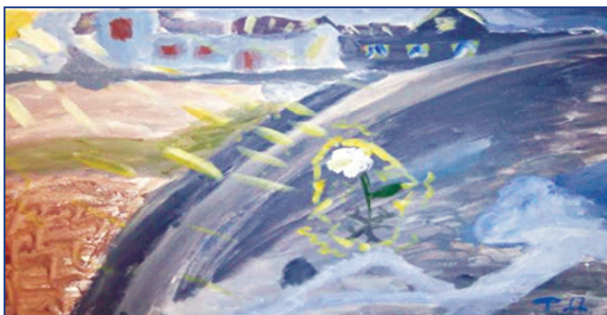
Рисунок 3 – Сублимация эмоций через арт-терапию