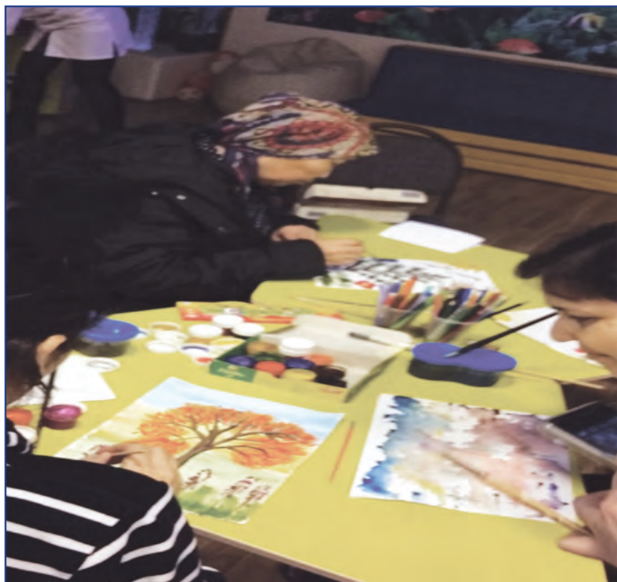
Рисунок 2 – Групповая арт-терапия с онкопациентами

Применение арт-терапии в работе с онкологическими больными даёт определенные результаты, когда пациенты с онкологическими заболеваниями не только визуализируют исцеляющие образы, но и стараются передавать их средствами изобразительного искусства (рисунки 2, 3).